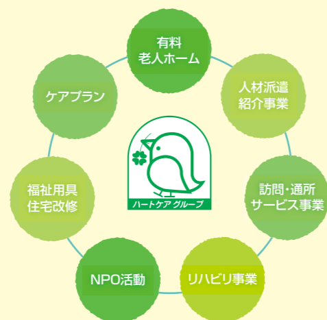
ハートケアグループの事業領域

ハートケアグループ最大の使命は、ご利用者様の“自立支援”をサポートすること。では、どんな事業やサービスが“自立支援”に有効なのでしょう? 私たちは当初、自分たち