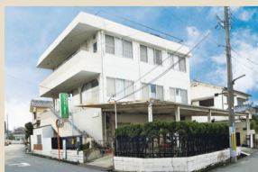
ケアホーム春日丘(藤井寺市)