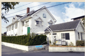
ケアホームつばきの丘(羽曳野市)