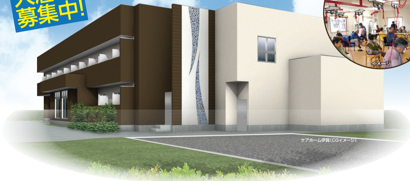
ケアホーム伊賀(CGイメージ)