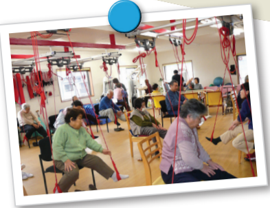
●スリングセラピー: 音楽に合わせて行う楽しいリハビリメニュー