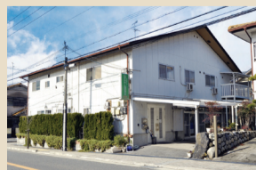
ケアホーム西つばきの丘(羽曳野市)