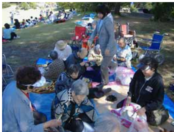
広場でシートを広げ松茸弁当を食べました