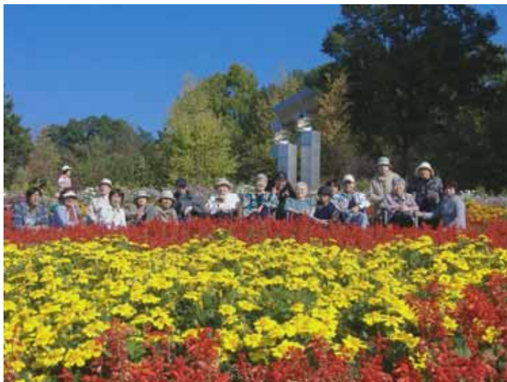
正面玄関の花畑の前にて

10月28日（日）に3ホーム合同で河内長野の花の文化園に行きました。 お天気もよくお弁当を持って遠足気分です楽しい一日を過ごしました。