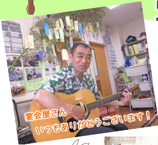
宴会屋さん いつもありがとうございます!