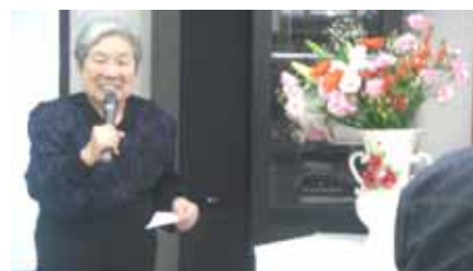
代表としてご挨拶されるご入居者様