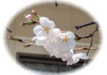
青蓮荘の庭の桜です。