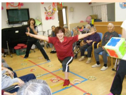
サイコロふって輪投げ渡りゲーム