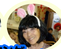
じゃんけんゲーム