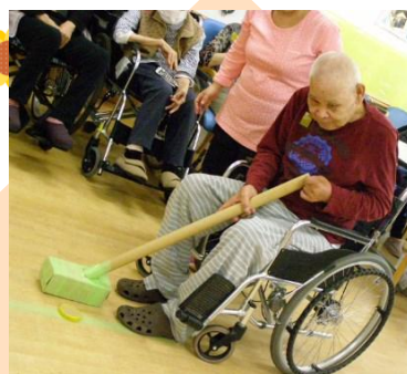
カーリングゴルフ