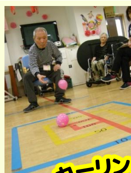
カーリングヨーヨー