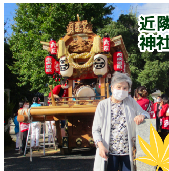
近隣のイベントや 神社へお散歩に

軽い運動もかねてピンポン玉リレーやカルタに興じたり、スポーツの秋を楽しまれる方もいらっしゃいました。寒さが厳しくなる前に、もう少し秋を堪能したいと思います！