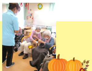
ピンポン玉リレー